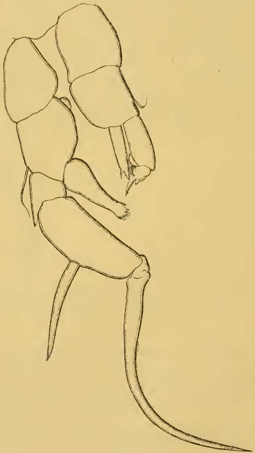
Fig. 6. — D. Schmackeri ♂. Pattes de la cinquième paire.